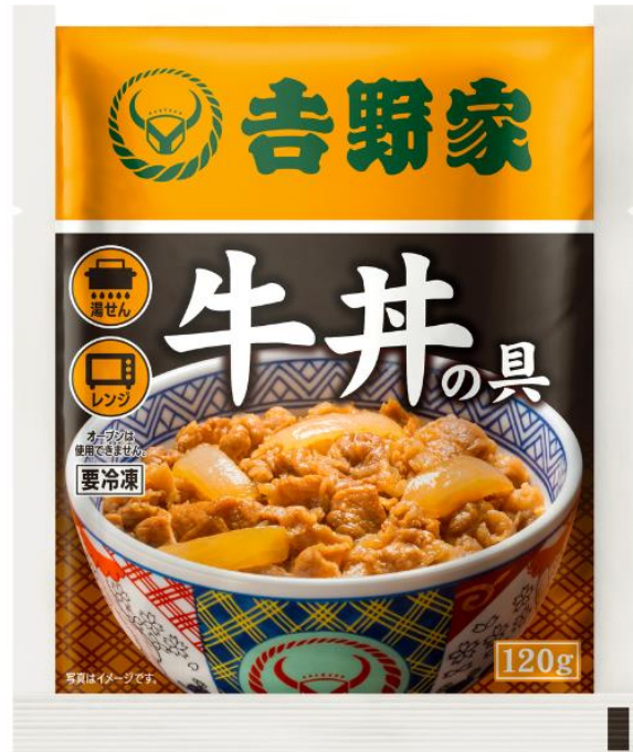
2026年 現在のパッケージ