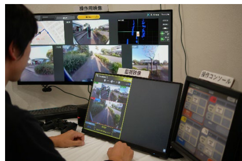
遠隔オペレーター