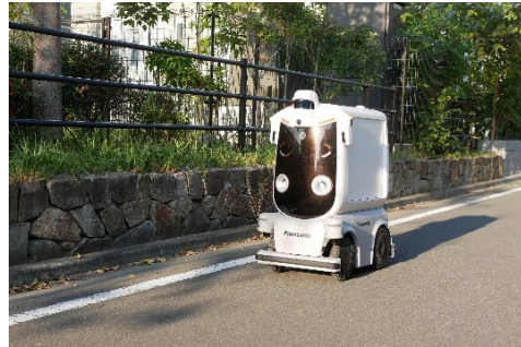
Fujisawa SST 内を自動走行