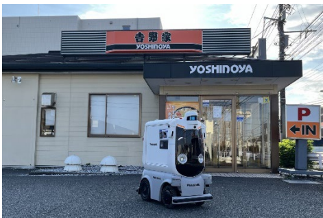
吉野家店舗を出発