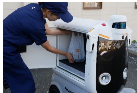
吉野家店舗での積み込み