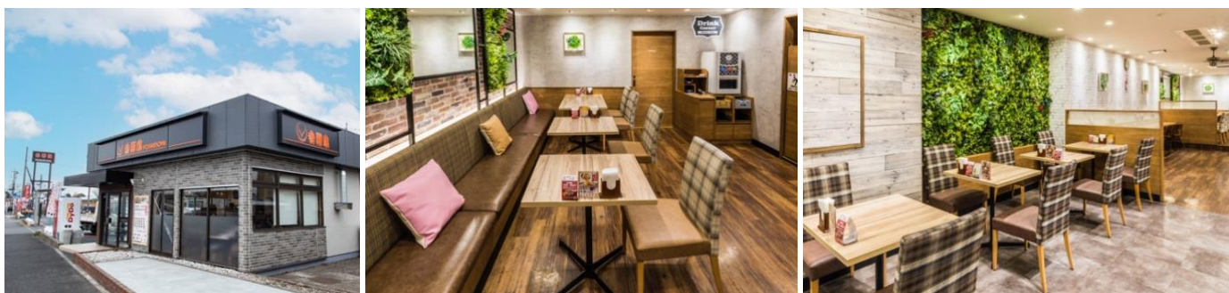
「クッキング & コンフォート」スタイル店舗

2016年以降、ゆっくりと寛ぎながら食事を楽しむことができる「クッキング & コンフォート」スタイルの店舗を拡大しています。また、コロナ禍で定着したテイクアウトやデリバリー需要の高まりを受けて、2022年以降は「テイクアウト・デリバリー専門店」の出店を拡大しています。吉野家の国内店舗数は2023年11月末時点で1,228店舗、そのうち「クッキング & コンフォート」スタイルの店舗は300店舗以上、「テイクアウト・デリバリー専門店」は30店舗以上を占めています。