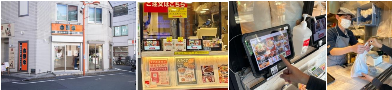
「テイクアウト・デリバリー専門店」