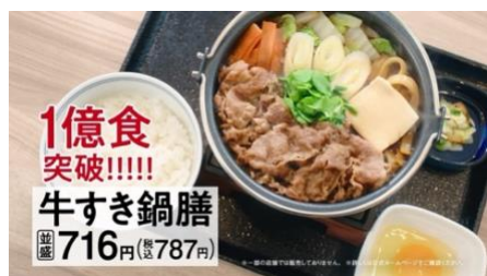
NA. 吉野家の牛すき鍋膳、1億食突破！！