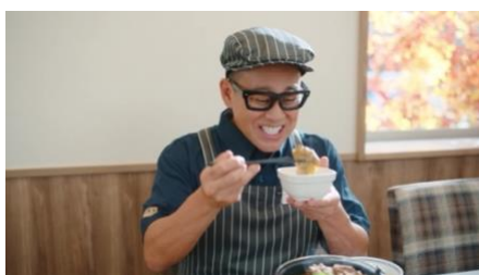
愛されてますなー