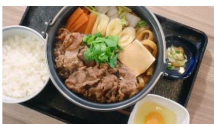
牛すき鍋膳、1億食突破です！！