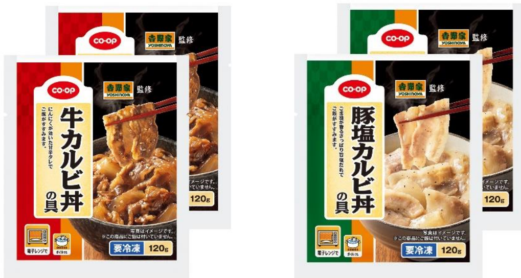
CO・OP & 吉野家 < 吉野家監修 > 牛カルビ丼の具 / CO・OP & 吉野家 < 吉野家監修 > 豚塩カルビ丼の具

これまで、各地域生協と吉野家は、ご家庭でも吉野家の“牛丼”の味を味わっていただくために1993年に吉野家「冷凍牛丼の具」を共同開発し、生協で本商品を取り扱うなど、約30年間交流を重ねてきましたが、この度、初めてCO・OP商品と吉野家のコラボ商品を発売することになりました。「CO・OP & 吉野家」で販売を開始する冷凍食品「牛カルビ丼の具」「豚塩カルビ丼の具」は、共に吉野家の店舗では提供していない「CO・OP & 吉野家」限定商品となります。外食で楽しめる本格的な「カルビ」をご家庭でも味わえるように、厚めのスライス肉をじっくり香ばしく焼き上げ、吉野家監修の元、新たに作り上げたオリジナルのたれを絡めて仕上げています。丼の具としてはもちろん、ご飯のおかずとしてもお楽しみください。