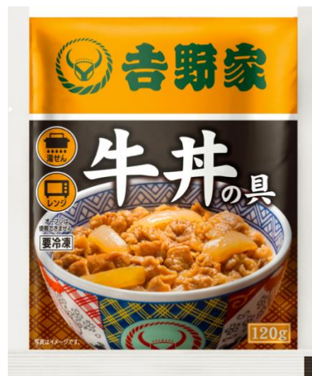
2023 年現在のパッケージ