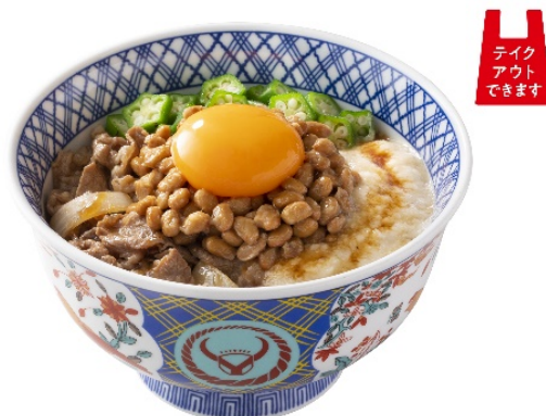
『ネバとろ牛丼』 598 円(税込 657 円)