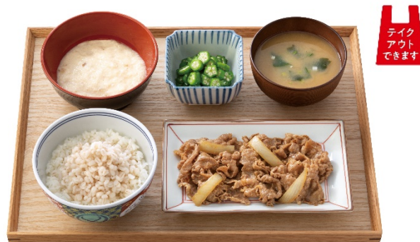
『牛皿麦とろ御膳』 598円(税込 657円)