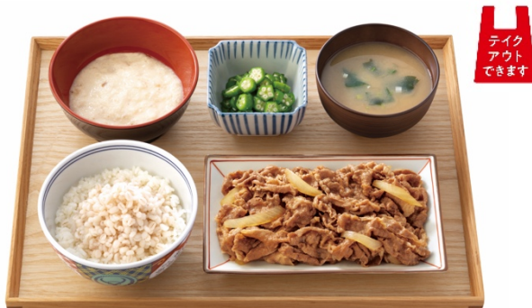
『牛皿麦とろ御膳 肉2倍盛』 876円(税込 962円)