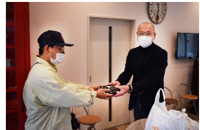
児童養護施設などの子どもたちに あたたかい「牛丼弁当」を提供

今後は4月以降も施設へ食事をお届けし、取り組みの範囲を拡大したいと考えています。現在も、あらゆる生活環境や家庭環境によって施設などで食事をする子どもたちや、長期化するコロナ禍で生活が変化して今まで通りの食事が難しい家庭も多く存在しています。本取り組みがこのような状況下の子どもたちや子どもたちを支援する方々の一助となればと思っています。