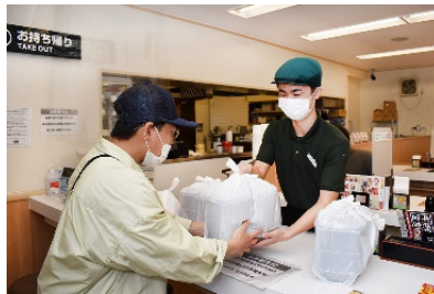
できたての「牛丼弁当」を 出前館の配達員にお渡し