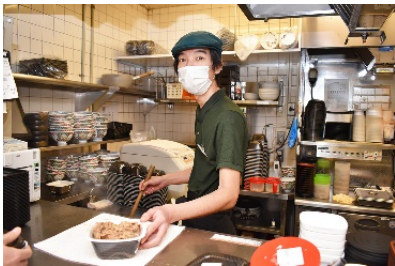
吉野家にて 「牛丼弁当」を作成