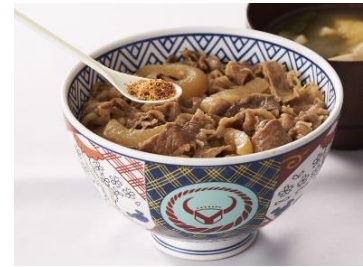
もちろん牛丼にも！